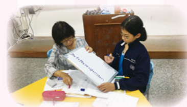
· 用小白板輔助教學