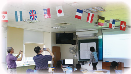
· 公開授課 互相成長