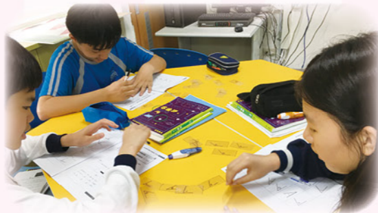
· 自製教材，幫助學生學習