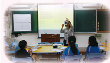
· Pickers 線上回饋即時評量

校內團隊教學有愛、學生學習無礙，慧敏老師利用課餘時間積極參加相關研習及成長活動，並經常觀看相關教學影片及閱讀書籍，將所學適時融入教學中，慧敏老師衷心感覺出之己少，得之人多，心存感恩！