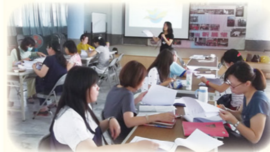
· 透過閱讀理解策略教學社群進行共備