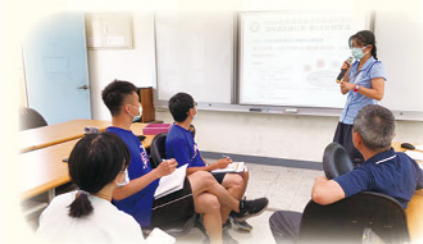
· 召開因材網社群會議

依據科技化評量系統測驗結果設計多元活動，調整教學策略，實施桌遊融入領域教學，透過遊戲式的競賽，提高學習樂趣，幫助學生藉由有趣的活動，從玩中學，提高學習意願。國語文有拼字遊戲、注音桌遊、注音賓果遊戲、「字族文課程」。英語文有桌遊融入英語教學，讓孩子透過遊戲加深印象，逐漸轉化至長期記憶裡，提升學習成效。數學則有自製數學桌遊教具、分數心臟病、因數大老二等，在遊戲過程中讓學生具體實作以理解抽象概念，透過反覆操作，深化數學概念，不再害怕學習數學。