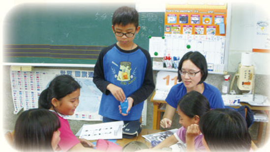
· 英語單字心臟病遊戲

透過均一教育平台融入學習扶助、因材網結合學習扶助等研習熟悉各平臺的操作，將數位學習導入教學，匯入學習扶助科技化評量系統測驗結果報告，針對不同程度的學生進行差異化教學，給予不同任務。南安國小更被錄取為109年度教育部適性教學基地學校，使用因材網進行學習扶助，使不同學習速度的學生能依其需求差異獲得適性學習，讓每位學生找到自己的學習步調，提升學習成就。