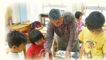
· 指導學生數學桌遊