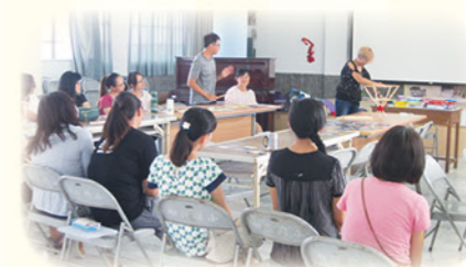
· 桌遊融入領域教學研習

領航團隊由教學經驗豐富的資深教師及充滿創意的熱血教師共同組成，教師均為編制內正式教師，在團隊長期經營下，教師均了解學生家庭背景，主動與家長聯繫，溝通孩子的學習狀況，亦經常與原班老師進行教學對話，掌握學生特性，因材施教。除指導課業之外，更關心孩子的生活大小事，透過團隊的用心，讓孩子愛上學習！