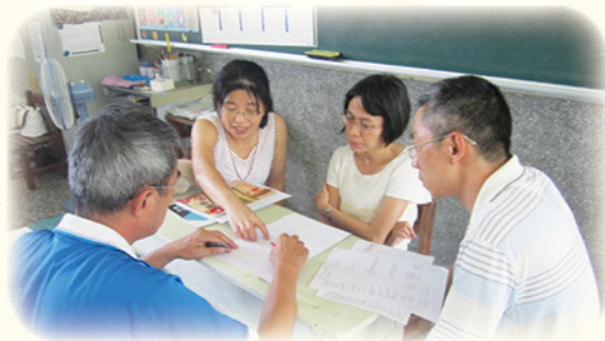
· 授課老師與原級任老師進行教學對話