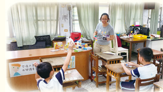
· 結合榮譽幣運用拍賣會的方式進行獎勵