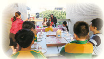
· 老師在課堂上回應學生情緒問題

學校規劃教師專業對話時間，積極辦理全校學習扶助研習，讓老師了解學習扶助的精神與科技化評量系統的使用。團隊之間進行課室觀察，分享教學經驗，對於初任的學習扶助教師，團隊分享教學經驗，並積極鼓勵參加校外研習課程，包含永齡課程、課文本位閱讀理解教學，吸收並導入最新的知能，運用前後測多元評量，了解學生的學習脈絡，編製適性的教材，設計創新的課程。