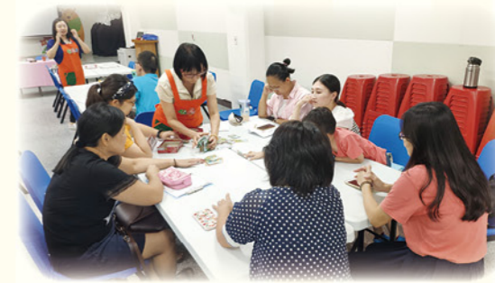
· 辦理桌遊增能研習，打造多元有趣的課堂