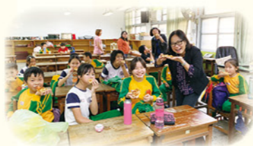
· 校長於期末結業式和學生同樂鼓勵學生