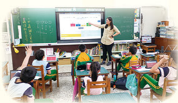
· 行政提供智慧教室與平板豐富 E 化教學