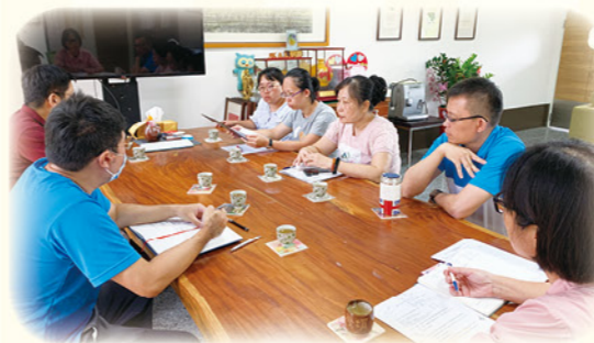
· 定期召開學習輔導小組會議

喀哩國小的孩子們家庭背景多元，有隔代教養、單親、新住民等，部分孩子在學習上以及情感的陪伴上較為不足，領航團隊成員秉著教育熱忱、教育愛與專業的態度，投入全部心力，創造一個快樂又溫暖的學習環境，只為了聽到孩子的一句話：「老師！我覺得學習好像沒那麼難」。幫助孩子找回學習的信心，讓孩子們從內心啟動學習引擎，建立自信，迎向未來！