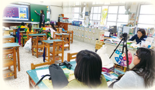
· 領航團隊教師進行課室觀察與其他學扶老師交流