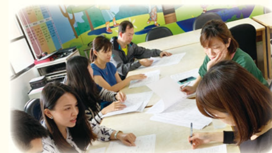
· 學習輔導小組會議掌握每位學生概況