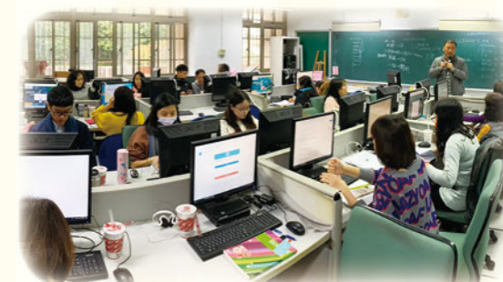
· 教師學習扶助社群研習 - 因材施教應用