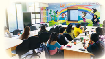
· 教師學習扶助社群例月增能研習