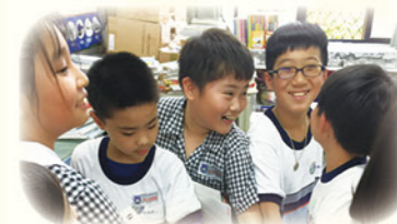
· 英語多元教學 - 遊戲學習