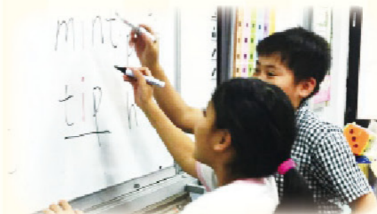
· 英語多元學習 - 小組競賽

於期初發送「家長通知單」，了解家長期望與學生待增強之能力；於期末應用「受輔學生回饋單」，了解學生的學習概況、課堂感受、興趣與表現等，提供教師教材設計、親師生互動、適性教學策略之參考。