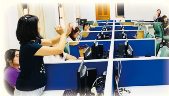
· 透過社群認識資源平臺之有效應用