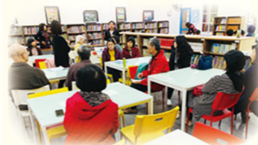
· 志工晨光學習扶助組與行政之例會討論

團隊認為外在環境因素與個人內在因素，皆影響學生學習，在推動上採行政、教師、家長、志工四環並進，共同改善文化不利、經濟不利等外在因素，以及學習障礙、情緒障礙、行為障礙等內在因素。行政事務由輔導處主責，橫向聯繫輔導、特教、社工師等資源併入。除推動小組定期會議外，另成立學習扶助教師專業社群，以每月例會方式進行教師之交流、對話與研習增能，並透過期末的社群成果發表，回饋導師與科任教師意見。而晨光志工學習扶助課程，更是透過家長的力量，利用早自習課輔學生，增進學生練習的機會，亦提供無法參與課後學習扶助課程的孩子另一學習時機。