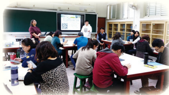
· 每學期定期召開輔導小組會議