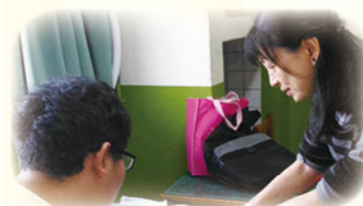
· 教師一對一指導學生

學生參與學習扶助課程後，較以往有明顯的學習興趣與信心，願意發表及參與討論次數增多，學生在定期評量與科技化評量的測驗成績進步率也大幅成長。當學生「想學習」的態度逐漸展現出來，更在乎自己的學習表現時，學習是持續的進行中。