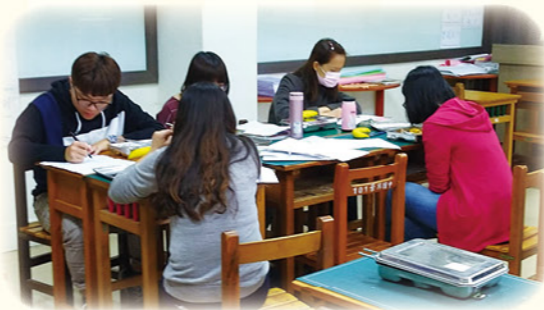
· 團隊利用午餐時間進行課程共備