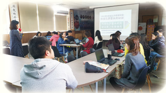
· 教務主任帶領任課老師共備討論

景興國中學生自入學，即可接受三年一貫的學習扶助：七上開設每周兩節的「課後學習扶助班」，七下至九下開設「課中學習扶助班」，寒、暑假亦開設「學習扶助班」，提供學生良好學習環境。