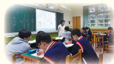
· 小組協助同學學習