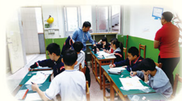
· 學習扶助班公開授課