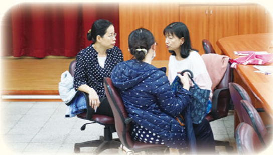
· 透過「學校日」進行親師溝通