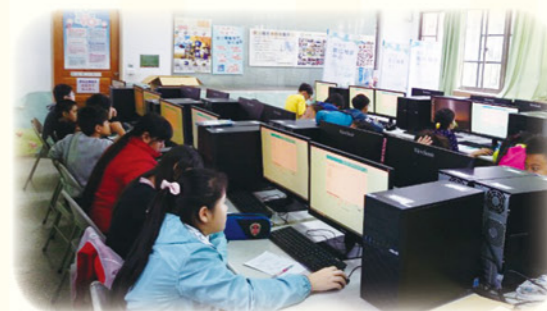
· 施測未通過則進行下修測驗，找到學習弱點，調整學生學習內容