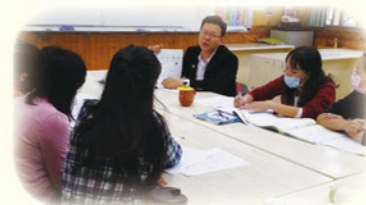
· 校長與教師進行數學共備