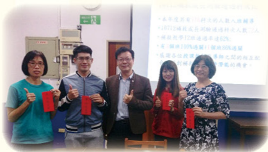
· 表揚並頒發獎金予成長測驗通過率高之授課教師