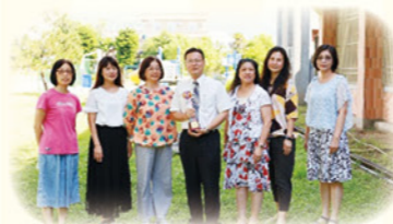
· 本校學習扶助領航團隊成員