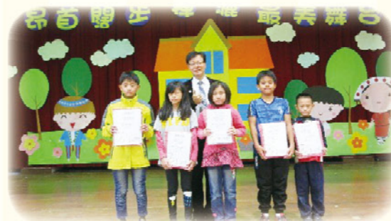
· 表揚並頒發獎金予成長測驗通過率高之授課教師

團隊引進多元教材，除部編版的學習扶助教材外，也引用民間資源，團隊教師利用多元網路教學平臺輔助教學，包括科技化評量網站、均一平台及因材網等。高品質的學習扶助來自「專業的教師團隊+完善的行政規劃+豐富的教學資源」，只要用心，孩子就能進步！