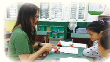
· 使用教具個別或分組指導學生