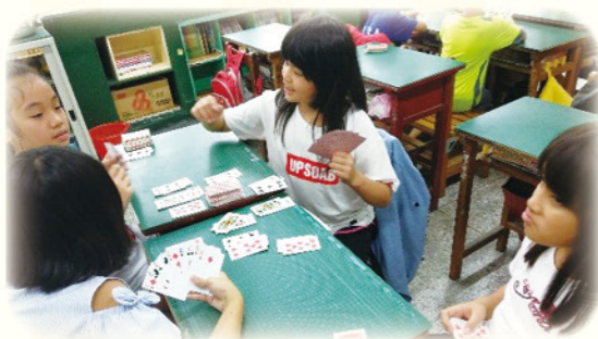
· 多元有趣的教學內容，寓教於樂，重燃學習興趣

學習扶助要真正落實，教師須具有高度教學熱忱與專業能力，診斷並瞭解學生學習困難點而對症下藥。每一期開班前，領航團隊教師依據學生測驗報告，瞭解學生學習起始能力，與原班教師溝通，規劃適性化教學方案。校長每學期參與各年段教師數學領域共備課程，並分析篩選測驗各年級數學錯誤率較高的題目與教師們進行教學策略研討與專業對話。