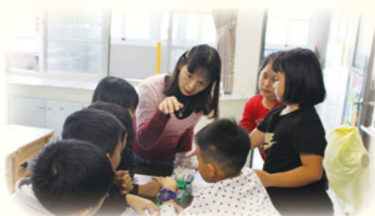
· 學生實際操作，建立基礎觀念