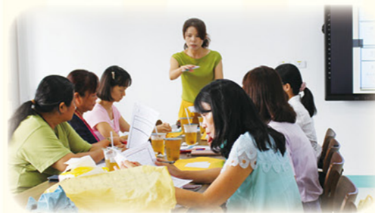
· 主任與教師共備研討

領航團隊等待孩子的進步，欣賞孩子的亮點，讚許孩子的成功。「老師，我愛您」、「老師，我喜歡上學習扶助班」、「老師，你的話讓我的心融化了」。讀著孩子回饋的甜言蜜語，真誠與他們擁抱，形塑溫暖而友善的氛圍。「唯有用心，才能真切看見」，領航團隊祈願自己教學耕耘的一小步，創造出孩子學習成長的一大步。