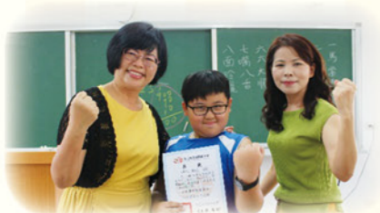
· 學生獲頒亮點獎狀，流露自信笑容

「每一個生命都有存在的價值與意義」，永靖國小教學團隊堅信每個孩子都有值得期待的潛能。團隊和孩子並肩前行，以堅實的耐心為圓心、豐盈的愛心為半徑，陪伴他們走出學習低谷，帶領孩子畫出希望的圓。