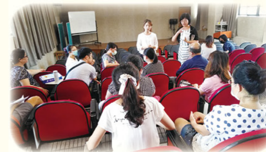
· 校長、主任與導師專業對話