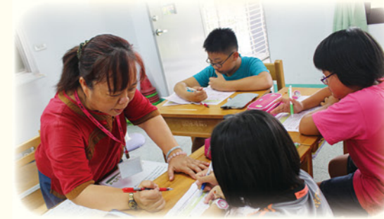
· 教師即時進行個別指導