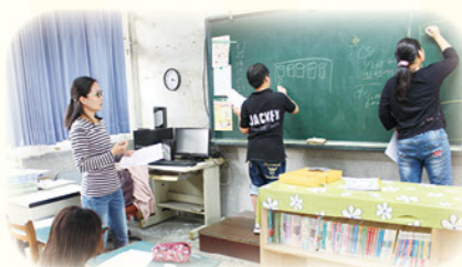
· 上臺實際演練，提升學習動力