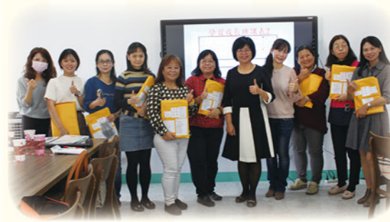
· 校長領導陣容堅強的教學團隊