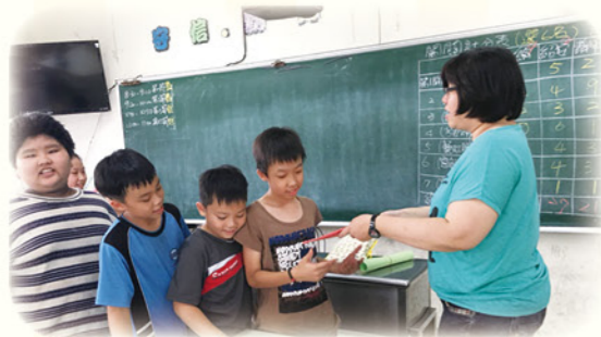
· 學期結束後，老師頒發獎品，鼓勵小朋友

領航團隊依據線上測驗並參照班級成績，比較學生篩選測驗與成長測驗的差異，選定適合學生之教材。由學習單確認學生學習成果，調整教學策略及進度。教師透過小組合作學習、口頭發表、線上學習平臺等形式，提供不同需求的學習輔導；更鼓勵學生擔任小老師，協助同學。針對學生實質的進步，適時給予口頭肯定與實質獎勵，強化學生學習熱忱。每一班別均填寫回饋單，學生對學習興趣與信心較以往增加 90% 以上，加上學扶班有許多口語表達的機會，孩子回到原班後參與討論的意願與能力也相對提高；在領航團隊的努力下，本校學生國、數、英成績都高於本市平均！