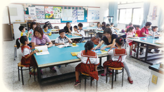
· 愛心媽媽進行一年級學生注音符號指導