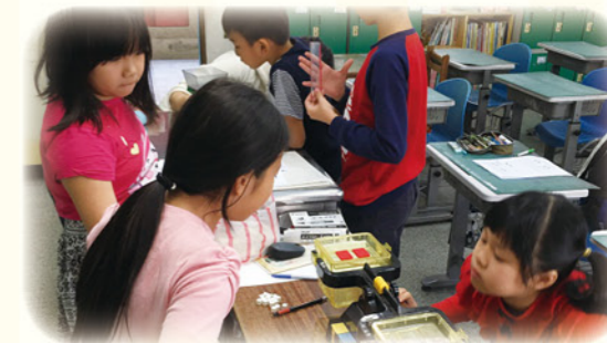
· 親手操作體驗學習