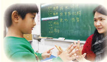
· 師生一對一個別教學