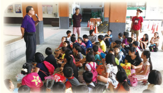
· 開班結束後，由校長頒發獎狀、獎品鼓勵學生

學期中每週二愛心媽媽製作點心及飲料提供學生於課輔時享用，提升學生學習動力；組訓愛心媽媽教導一年級學生的學習扶助課程，透過愛心媽媽的陪伴及輔導，及早改善學生的學習態度和學習方法。在豐富且綿密的學習網絡中，期許瑞興的孩子在滿滿的教育愛陪伴下學習，成長茁壯。