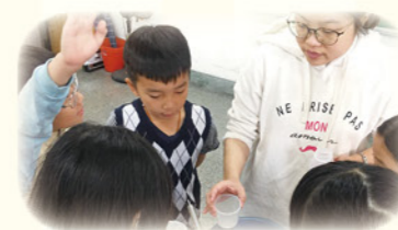
· 將數學容量單元融入做發糕中，提升學生學習興趣