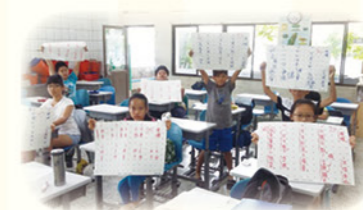
· 利用小白板進行教學，隨時了解學生學習反應並給予回饋