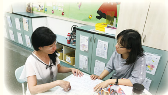
· 與原班老師討論學生狀況