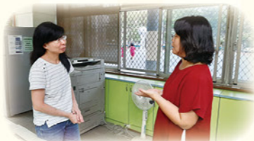
· 團隊教師與原班導師互動頻繁，討論學生學習狀況，調整教學策略