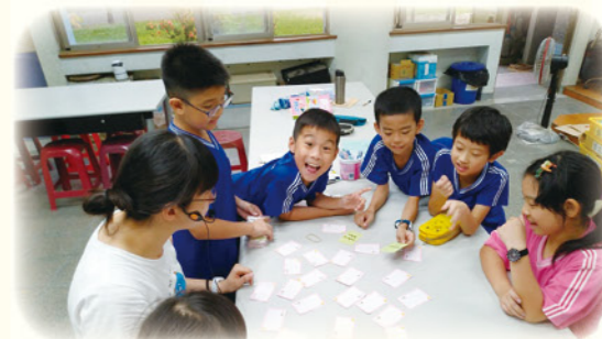
· 緊張刺激的字母翻牌記憶大挑戰，遊戲化學習，讓學習更有趣