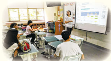
· 團隊教師積極進修，組成專業學習社群，共同討論線上平臺應用