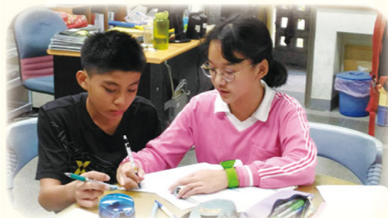
· 經由同儕指導增進自信