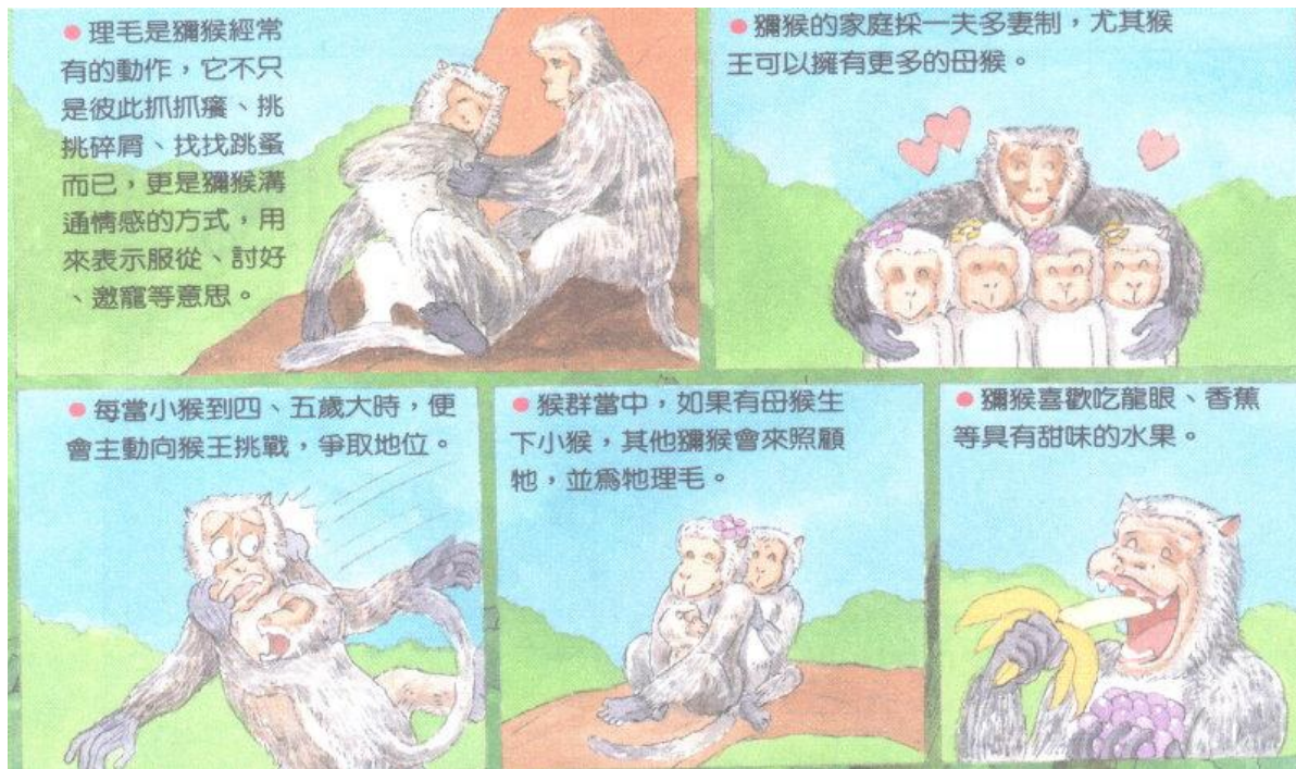
圖 2 台灣獼猴的習性