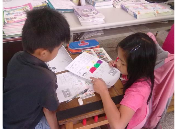
學生互相討論課文大意