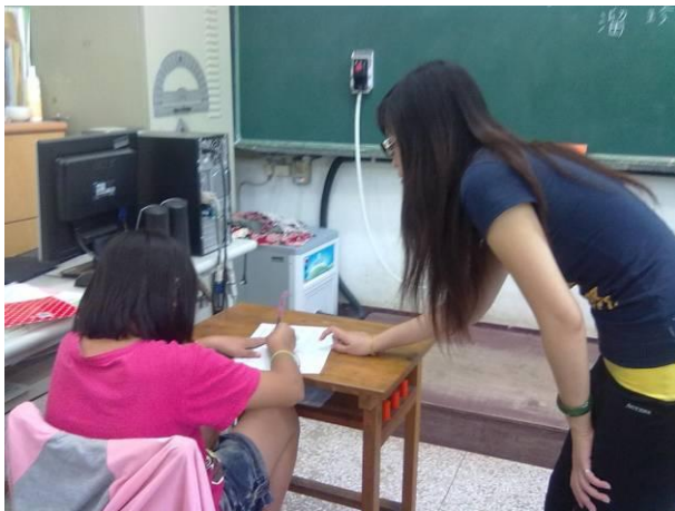
個別指導課文大意