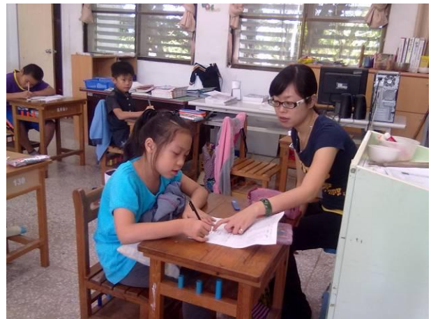
個別指導生字學習單習寫