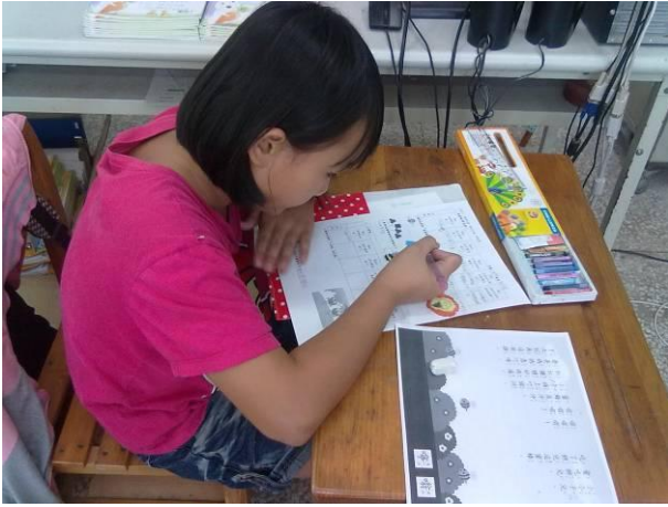
學生替學習單畫插圖