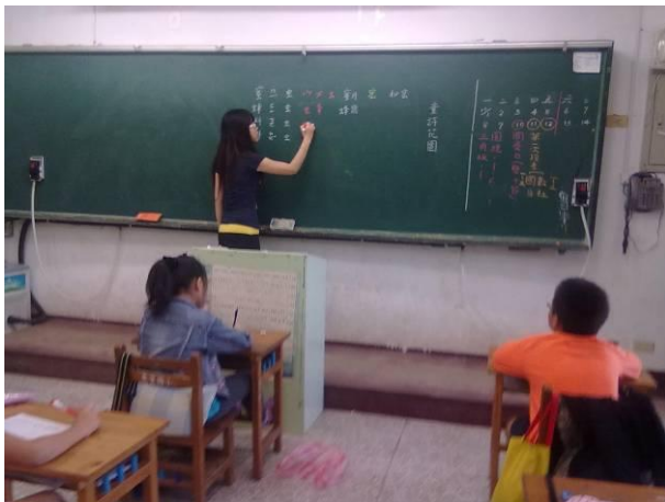
指導生字學習單書寫方法