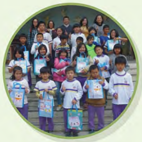
◎ 期末表揚，肯定孩子的努力