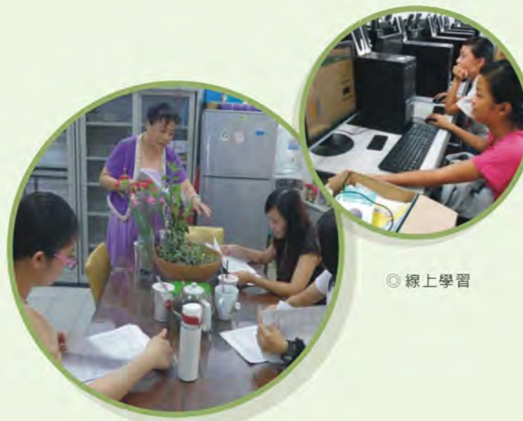
◎ 補救教學社群共同討論