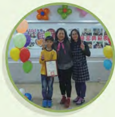
◎ 獲得嘉義市績優表揚

從行政端堅持不放棄的開班，遵循政策的走向，努力增能使我們變成了補救教學的專家。行政團隊於下班後陪同老師進行家訪，並提供行政資源：如教材、獎狀、點心、獎品與進修訊息分享等。更會到班上關心孩子的情形並適時為老師加油打氣，於無形中注入許多好的能量。